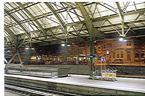
^ Siebzig Prozent des Lichtes wird auf die Perrons gerichtet, dreissig Prozent erhellen das Hallendach und indirekt den Raum.

SEHKOMFORT OHNE BLENDUNG In der weiteren Planung war die Blendung eines der zentralen Themen. Insbesondere die Lokomotivführer dürfen keinesfalls von den Leuchten geblendet oder abgelenkt werden, wenn sie in den Bahnhof einfahren; die Perronkante mit den wartenden Passagieren muss in sicherem Licht erstrahlen. Die Perronbeleuchtung darf aber auch die »