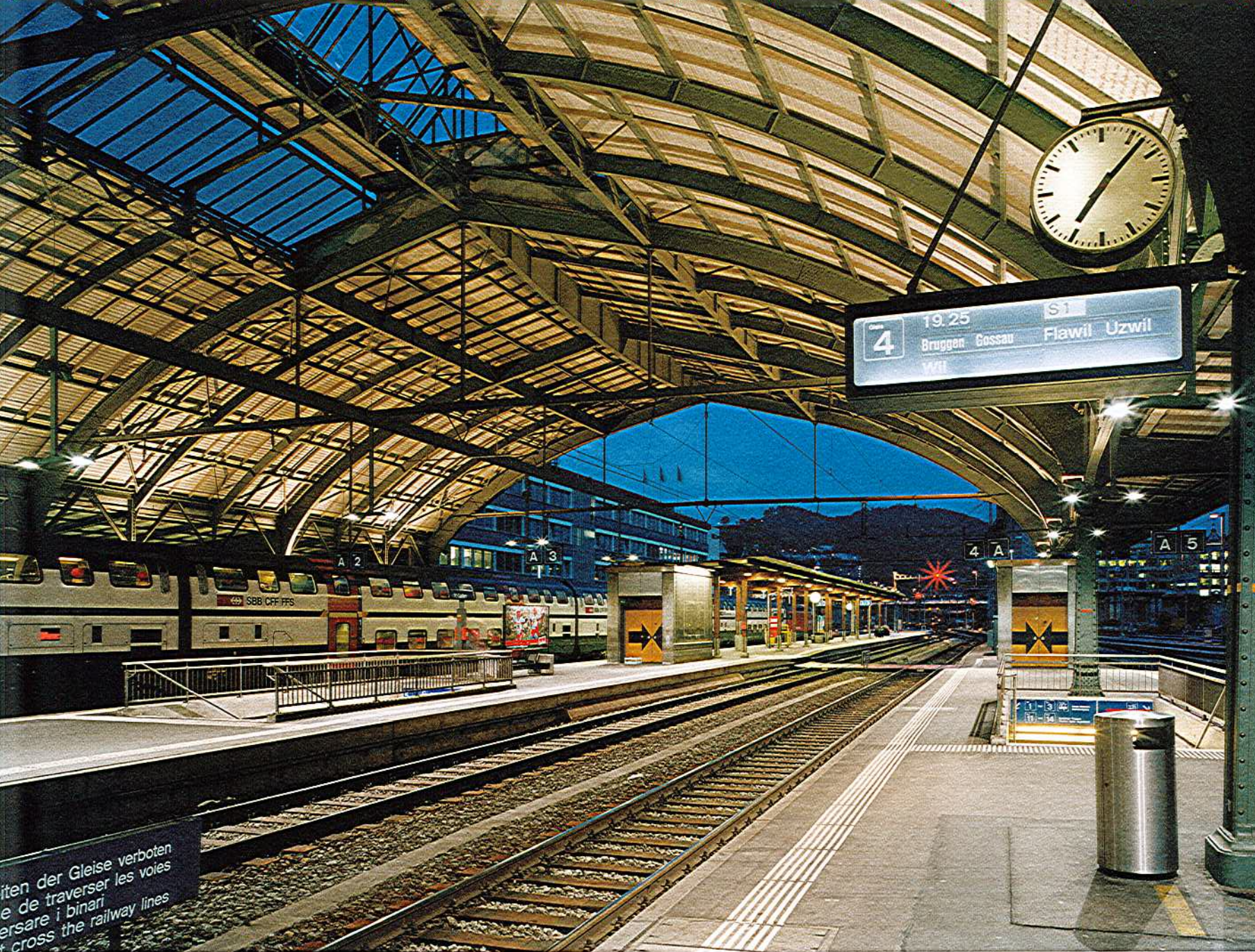
^Leuchtende Perronkanten und über allem ein dezent erhelltes Dach.